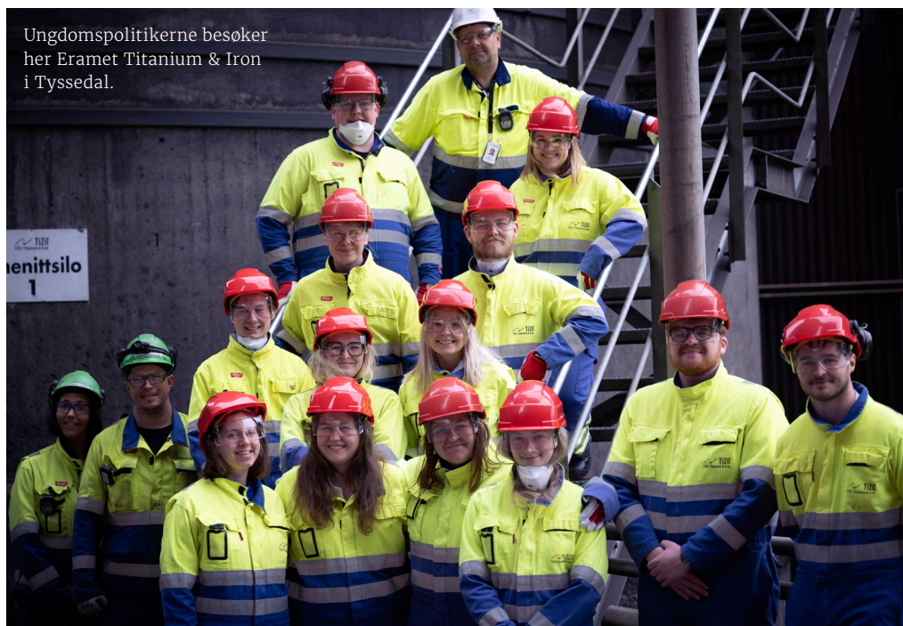
Ungdomspolitikere besøker her Eramet Titanium & Iron i Tyssedal.